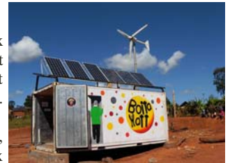
La boitawatt en mai 2011 !