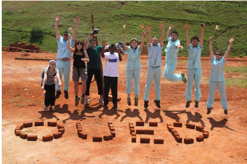
Organisation hUmantaire des Etudiants Dentaires (OUED)