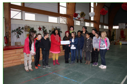
Remise du chèque du conseil municipal enfants